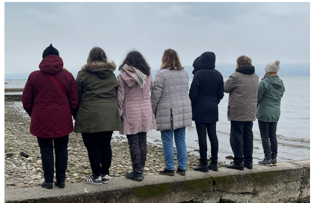
Fastenangebot 2022 in Langenargen

Beim gemeinsamen Start am Bodensee hatten die Teilnehmenden neben dem Genussfasten auch die Gelegenheit zur Ruhe zu kommen, neue Kraft zu schöpfen, leckeres und leicht bekömmliches Essen und schöne Spaziergänge zu genießen . Anschließend startete die 10-tägige Fastenzeit, welche durch regelmäßige Zoom-Treffen der Gruppe mit Frau Heizmann begleitet wurden und dem Erfahrungsaustausch und der Beratung rund um das Fasten im Alltag dienen.