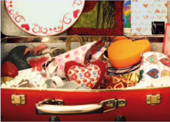
Herzenskoffer: Materialien zur Arbeit in der Herzens-Sprechstunde.