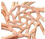
Ein Angebot des Projekts Menschen besuchen und begleiten

Am 2. Fortbildungstag können erste Praxiserfahrungen reflektiert, Fragen zur Umsetzung des Rahmenkonzepts gestellt und Ideen für die weitere Zusammenarbeit entwickelt werden.